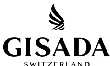
Swiss Fragrance GmbH Kollektivmitglied